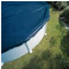
Cubierta de invierno Winter cover