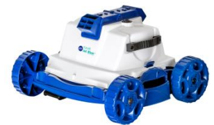
Robot Robot RKJ14