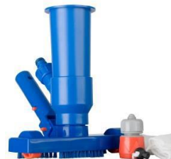
Limpiafondos Ventury Ventury vacuum 90111